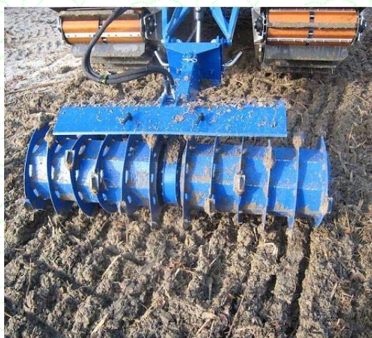
Культиватор с режущим барабаном