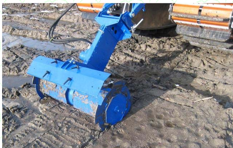
Культиватор с ножевым ротором

"Доромиллер" используется для рекультивации мягких грунтов. Возможно исполнение культиватора с различной рабочей шириной. Режущий барабан культиватора сменный и может быть отсоединен от привода.